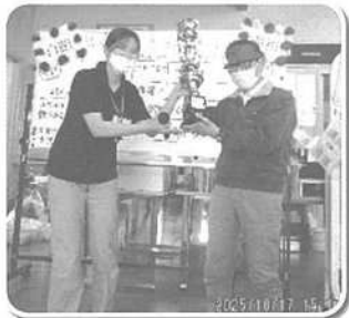
利用者の皆様で一丸となって大成功を納めた秋の大運動会！！