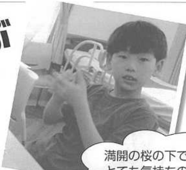
満開の桜の下で とても気持ちのいい お花見になりました