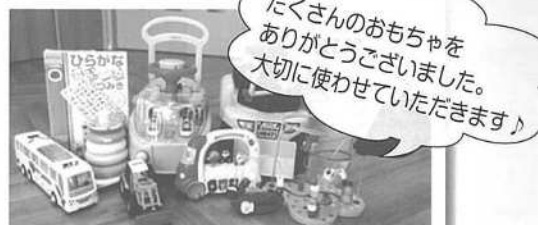
たくさんのおもちゃを ありがとうございました。 大切に使用させていただきます！