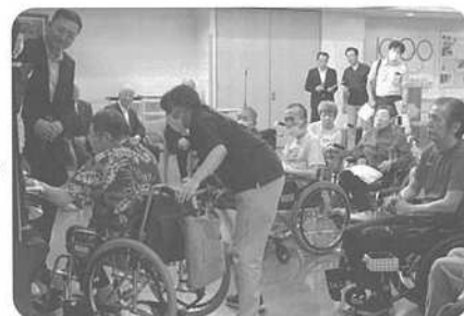
笑みがこぼれます