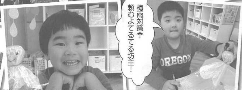
梅雨対策 頼むよてるてる坊主！