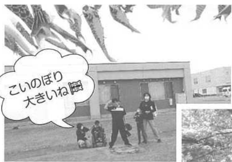
こいのぼり 大きいね