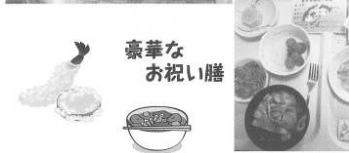
米寿おめでとう！ おめでとうございます。