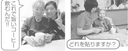
これで言いコーヒー 飲んだ！！