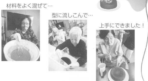
材料をよく混ぜて…