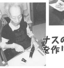
ナスの揚げ浸し を作りました！！