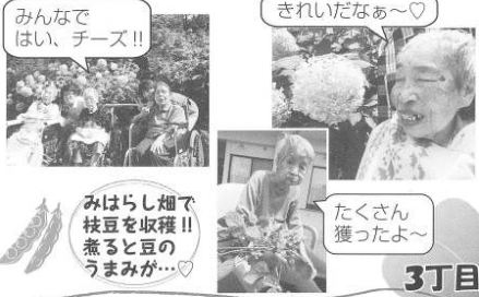
みんなで はい、チーズ！！

出塩文珠まできれいなあじさいを見に行ってきました。顔よりも大きなあじさいを見てうっとり♡