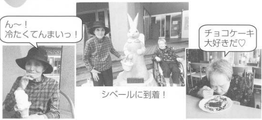
ん〜！冷たくてんまい！！