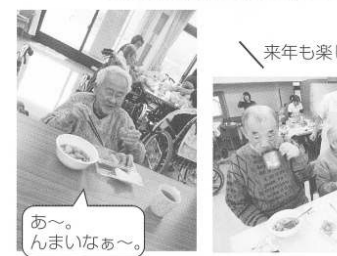
芋煮やうぐいす、んまいな〜！